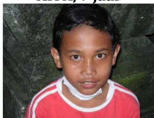
Isrok, 14 jaar