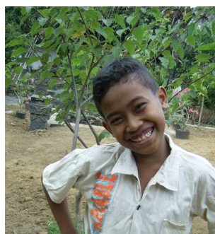
Boneng, 11 jaar