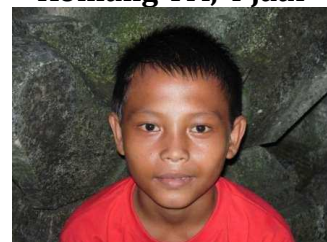
Merta, 13 jaar