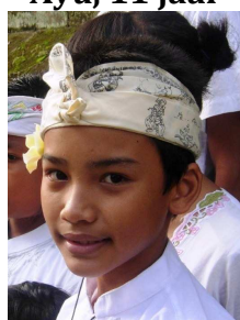
Perya, 11 jaar