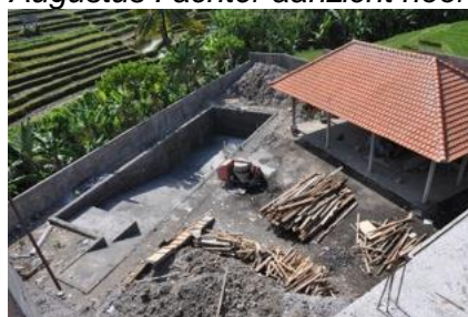
Bale, waaronder de zieke kinderen toch buiten kunnen zijn, in de schaduw.