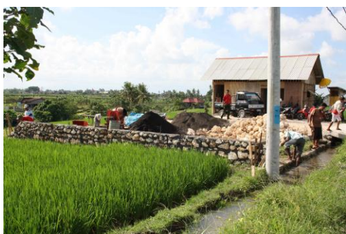
April : aanvang van de bouw.

En dat is gebeurd. Tijdens een gehouden benefietavond op Bali in een zeer luxe hotel is meer dan $ 100.000 dollar binnen gekomen. Een groot bedrijf in Australië deed ook een donatie voor de bouw van $ 100.000,= Als klap op de vuurpijl gaf een Brits bedrijf de benodigde financiën voor de aanleg van een aangepast zwembad, waar gehandicapte kinderen therapie in kunnen krijgen.