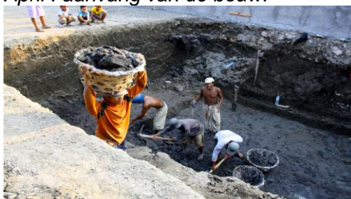
Zwembad wordt met de hand gegraven!